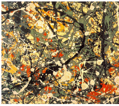
Pollock, Number 8, 1949 (détail) (Neuberger Museum, New York).

Quand Pollock fait des superpositions de plusieurs couleurs avec des gouttes de peinture, il fait du dripping (de l'anglais « goutter »). Parfois, il laisse couler la peinture sur la toile posée au sol, de façon continue et en perçant un trou au fond des pots afin que la couleur s'en échappe. Il balance son bras qui tient le pot de peinture pour que la peinture remplisse uniformément toute la surface de la toile (le « all over »). Ces deux techniques constituent une forme de l' Action Painting (peinture très gestuelle, c'est un « corps à corps » avec l'oeuvre).