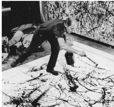
Pollock fait couler la peinture sur la toile : c'est du « dripping »