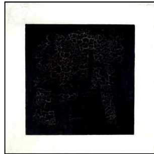
Malevitch, Carré noir sur fond blanc, 1915.

1915 : le russe Malevitch peint un carré noir sur un fond blanc. Il invente le Suprématisme , refusant la couleur et la forme même. La peinture se « dématérialise ». En 1918 il peindra un carré blanc sur fond blanc, considéré comme la première peinture monochrome (tableau d'une seule couleur). Le néant de la peinture ?